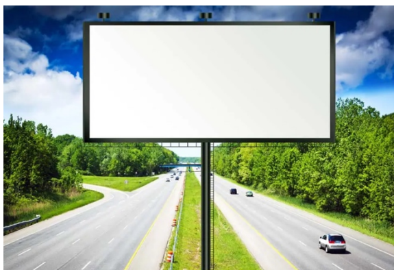
Рис.1. Пример расположения рекламного щита

Если рисунок заимствован из учебника, монографии или научной статьи, то есть не является авторским, то ссылка на источник обязательна. В данном случае в квадратных скобках указан номер из списка литературы, под которым стоит название источника, и номер страницы, где приведен рисунок.