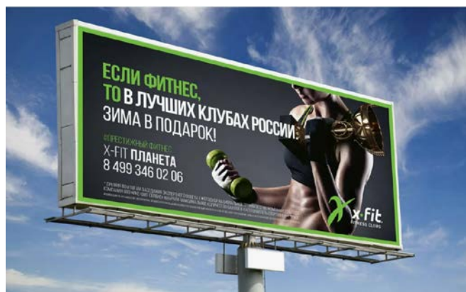
Рис. 8. Пример оформления рекламного щита компании X-FIT планета [8]

Рисунок не должен занимать более 1/3 страницы. В исключительных случаях разрешается его объем увеличивать до 1/2 страницы. Если размер рисунка превышает данные требования, либо при его уменьшении информация, размещенная в нем, становится «не читаемой», то такой рисунок (схему, диаграмму, график) переносят в приложение и увеличивают до необходимого для его прочтения размера.