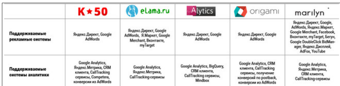
Таблица 1. Сравнительная таблица систем автоматизации

Заголовок рисунка помещается сразу после слова «Рис.» под соответствующим рисунком с выравниванием «по левому краю», начинается с прописной буквы и выделяется курсивом.