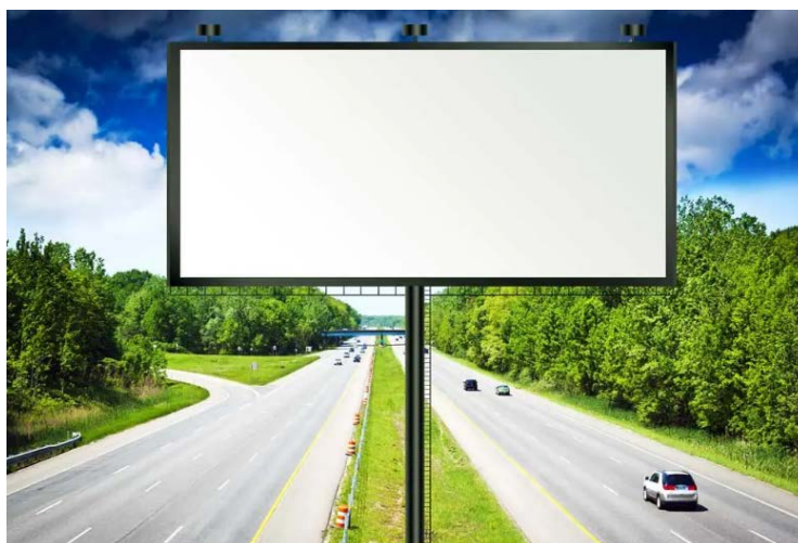
Рис.1. Пример расположения рекламного щита