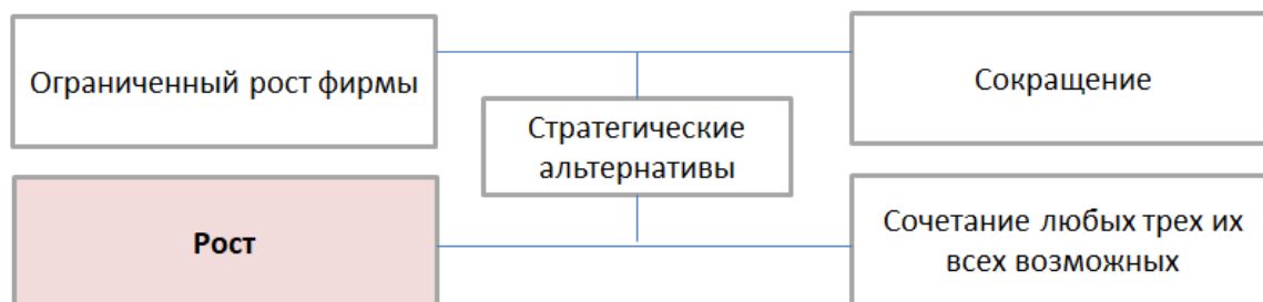
Рис. 2. Стратегические инициативы компании [8, с.12]

Если рисунок заимствован из учебника, монографии или научной статьи, то есть не является авторским, то ссылка на источник обязательна. В данном случае в квадратных скобках указан номер из списка литературы, под которым стоит название источника, и номер страницы, где приведен рисунок.