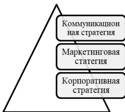
Рис.1. Соотношение стратегий предприятия

Если рисунок заимствован из учебника, монографии или научной статьи, то есть не является авторским, то ссылка на источник обязательна. В данном случае в квадратных скобках указан номер из списка литературы, под которым стоит название источника, и номер страницы, где приведен рисунок.