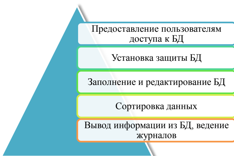
Рис. 1. Возможности СУБД