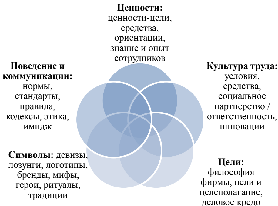
Рис.1. Основные элементы организационной культуры

По окончании прохождения практики, в срок не позднее 5-и календарных дней , студенты должны предоставить руководителю практики сформированный отчет о прохождении преддипломной практики.