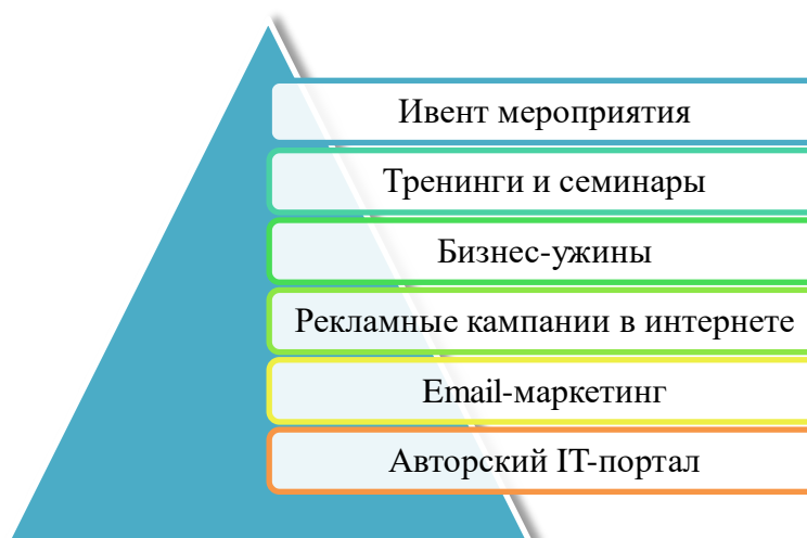
Рис. 1. Маркетинговая работа OCS