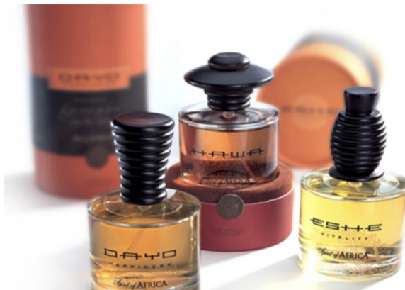
Рис.1. Айдентика бренда Wella Spirit of Africa

По окончании прохождения практики, в срок не позднее 5-и календарных дней , студенты должны предоставить руководителю практики сформированный отчет о прохождении учебной практики.