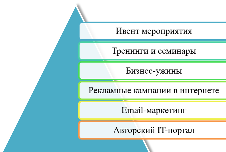
Рис. 1. Маркетинговая работа OCS