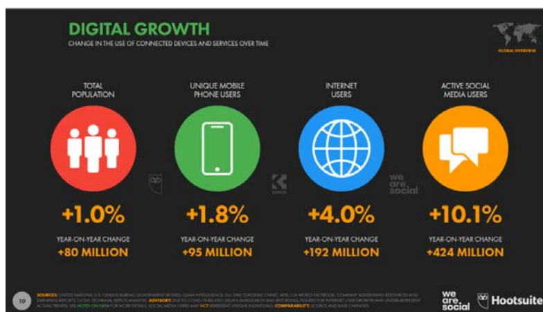
Рис. 3. Результаты ежегодного исследования Digital Global Overview Report [8]

Если рисунок заимствован из учебника, монографии, научной статьи, сайта и т.д. то есть не является авторским, то ссылка на источник обязательна. В данном случае в квадратных скобках указан номер из списка литературы, под которым стоит название источника и номер страницы, где приведен рисунок.