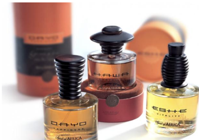
Рис.1. Айдентика бренда Wella Spirit of Africa