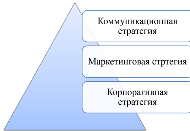
Рис.1. Соотношение стратегий предприятия

Если рисунок заимствован из учебника, монографии или научной статьи, то есть не является авторским, то ссылка на источник обязательна. В данном случае в квадратных скобках указан номер из списка литературы, под которым стоит название источника, и номер страницы, где приведен рисунок.