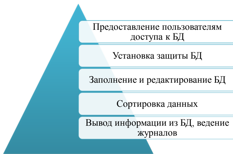
Рис. 1. Возможности СУБД