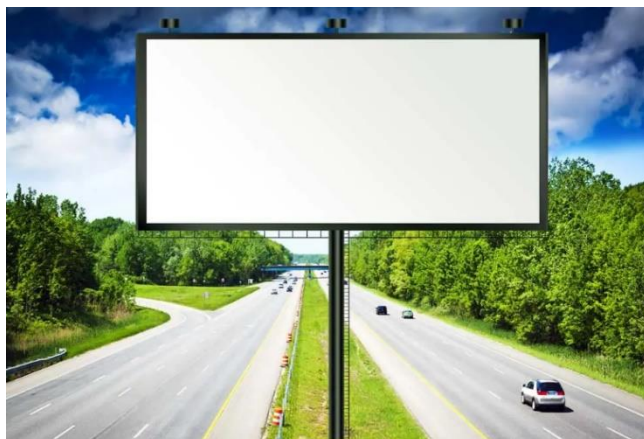
Рис.1. Пример расположения рекламного щита

Если рисунок заимствован из учебника, монографии или научной статьи, то есть не является авторским, то ссылка на источник обязательна. В данном случае в квадратных скобках указан номер из списка литературы, под которым стоит название источника, и номер страницы, где приведен рисунок.