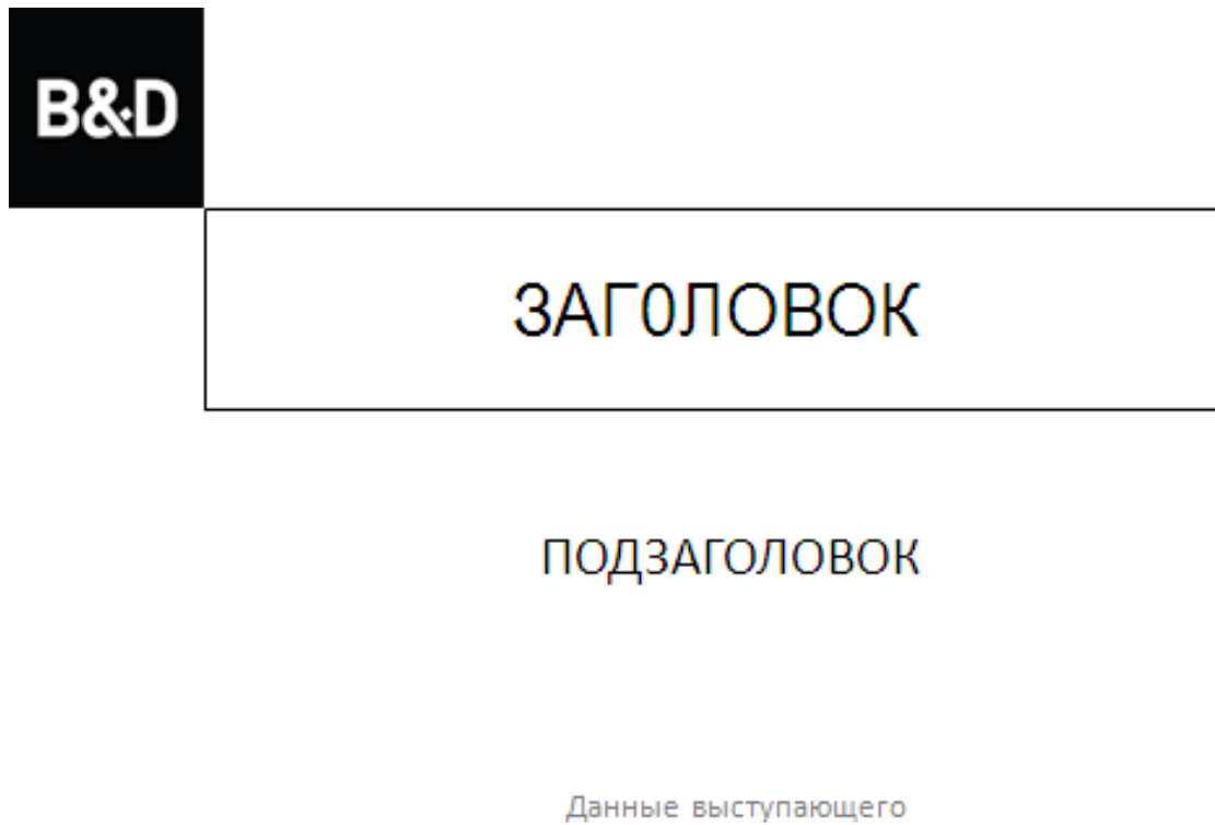
Рисунок 6.1– Образец слайда презентации