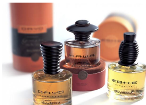
Рис.1. Айдентика бренда Wella Spirit of Africa

По окончании прохождения практики, в срок не позднее 5-и календарных дней , студенты должны предоставить руководителю практики сформированный отчет о прохождении производственной практики, преддипломной.