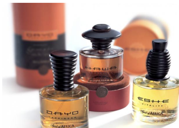
Рис.1. Айдентика бренда Wella Spirit of Africa

По окончании прохождения практики, в срок не позднее 5-и календарных дней , студенты должны предоставить руководителю практики сформированный отчет о прохождении учебной практики.